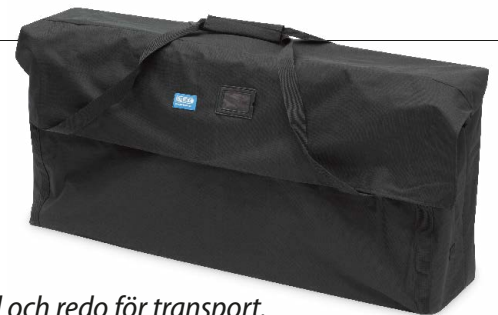
Hopfälld och redo för transport.